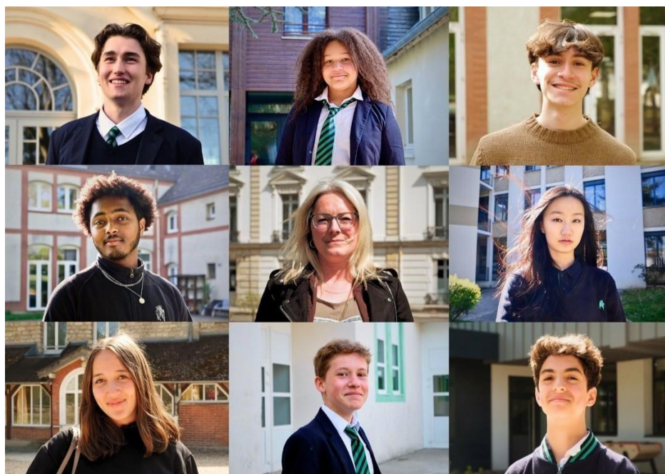
« Saint-Martin de France 2023 »