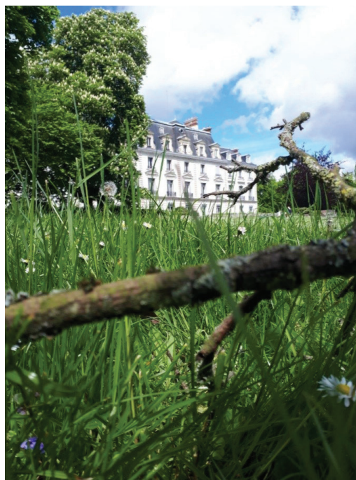
Jules DELSENY, 3 ème branche