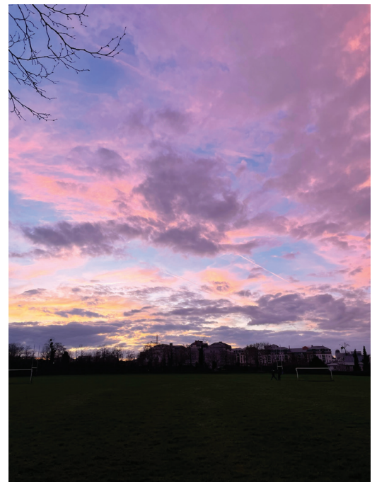
Alexis GAYE, T ale 4 Crépuscule